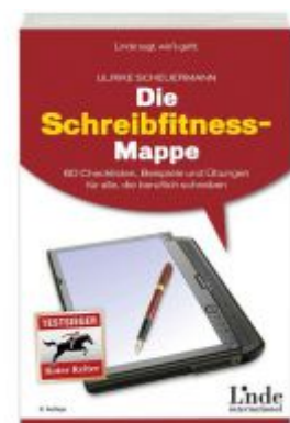
Die Schreibfitness-Mappe Ladenpreis: 19,90 EUR