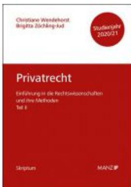
Privatrecht Einführung in die Rechtswissenschaften und ihre Methoden: Teil II Ladenpreis: 14,00 EUR