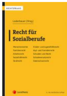
Recht für Sozialberufe Ladenpreis: 62,00 EUR