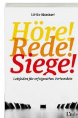
Höre-rede-siege! Ladenpreis: 19,90 EUR