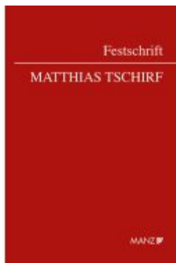
Festschrift Tschirf Ladenpreis: 64,00EUR