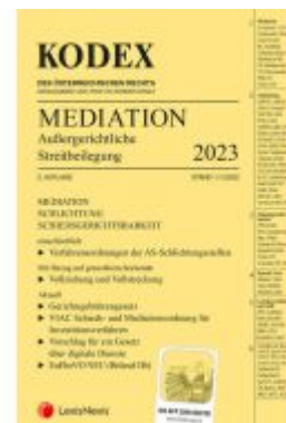
KODEX Mediation 2023 Ladenpreis: 32,00EUR