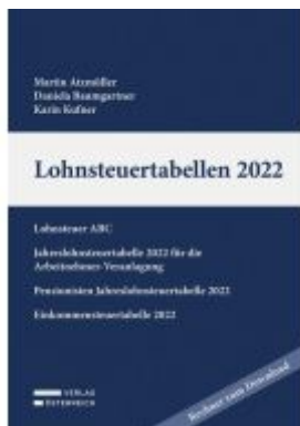
Lohnsteuertabellen 2022 Ladenpreis: 58,00EUR