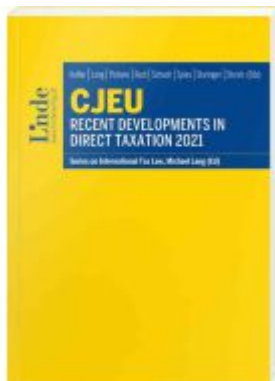
CJEU - Recent Developments in Direct Taxation 2021 Ladenpreis: 85,00EUR

Wir haben andere Produkte gefunden, die Ihnen gefallen könnten!