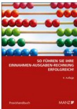
So führen Sie Ihre Einnahmen-Ausgaben- Rechnung erfolgreich! Ladenpreis: 23,80EUR