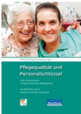
Pflegequalität und Personalschlüssel Ladenpreis: 29,80 EUR

Wir haben andere Produkte gefunden, die Ihnen gefallen könnten!