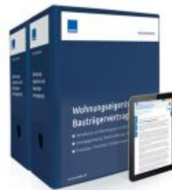
Wohnungseigentum und Bauträgervertragsrecht Ladenpreis: 261,80EUR