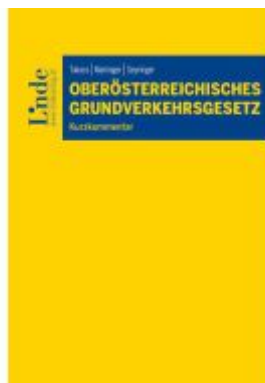
Oberösterreichisches Grundverkehrsgesetz Ladenpreis: 55,00EUR