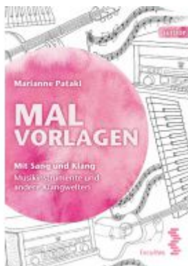
Malvorlagen Ladenpreis: 9,90 EUR