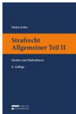
Strafrecht Allgemeiner Teil II Ladenpreis: 23,00 EUR