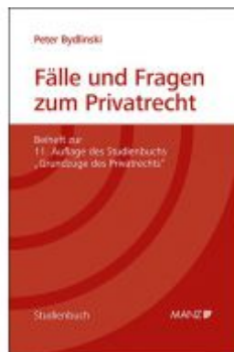
Fälle und Fragen zum Privatrecht Grundzüge des Privatrechts Ladenpreis: 24,80 EUR