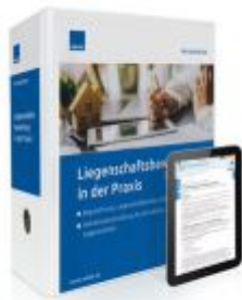
Liegenschaftsbewertung in der Praxis Ladenpreis: 207,90 EUR