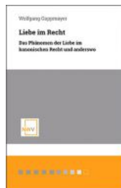
Liebe im Recht Ladenpreis: 48,00 EUR