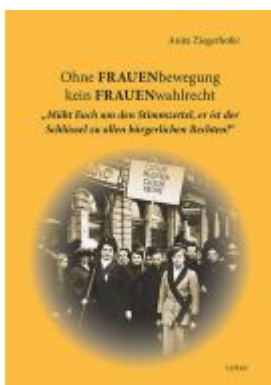
Ohne FRAUENbewegung kein FRAUENwahlrecht Ladenpreis: 17,90 EUR