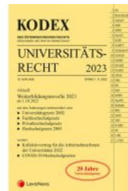
KODEX Universitätsrecht 2023 Ladenpreis: 62,00EUR