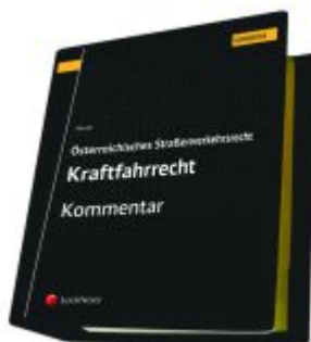
Österreichisches Straßenverkehrsrecht - Kraftfahrrecht Ladenpreis: 623,75EUR