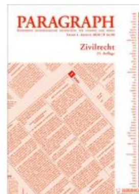
Paragraph - Zivilrecht Ladenpreis: 16,90 EUR