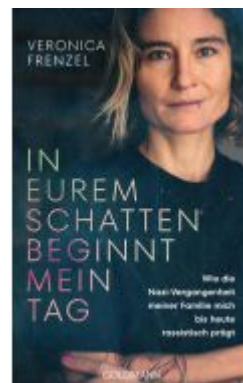
In eurem Schatten beginnt mein Tag Ladenpreis: 17,50EUR