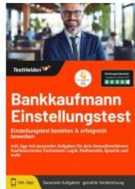
Bankkaufmann Einstellungstest: Einstellungstest bestehen & erfolgreich bewerben! Inkl. App mit tausenden Aufgaben für dein Auswahlverfahren: Kaufmännisches Fachwissen, Logik, Mathematik, Sprache und mehr Ladenpreis: 41,10EUR