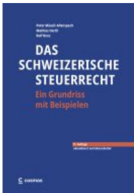
Das schweizerische Steuerrecht Ladenpreis: 178,00EUR

Wir haben andere Produkte gefunden, die Ihnen gefallen könnten!