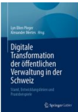
Digitale Transformation der öffentlichen Verwaltung in der Schweiz Ladenpreis: 61,68EUR