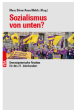
Sozialismus von unten? Ladenpreis: 20,40EUR