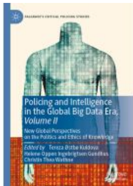
Policing and Intelligence in the Global Big Data Era, Volume II Ladenpreis: 153,99EUR