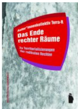
Das Ende rechter Räume Ladenpreis: 30,90EUR