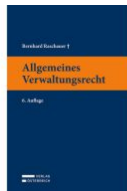
Allgemeines Verwaltungsrecht Ladenpreis: 49,00EUR