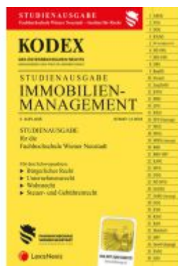
KODEX Immobilienmanagement 2024 - inkl. App Ladenpreis: 21,00EUR