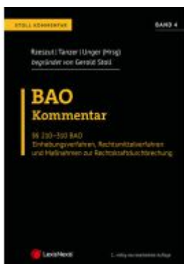
BAO Bundesabgabenordnung – Stoll Kommentar Band 4 Ladenpreis: 196,00EUR