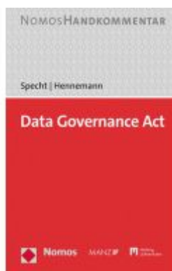
Data Governance Act Ladenpreis: 132,60EUR