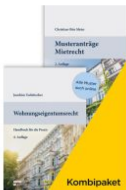
Kombipaket Musteranträge Mietrecht / Wohnungseigentumsrecht Ladenpreis: 119,00EUR