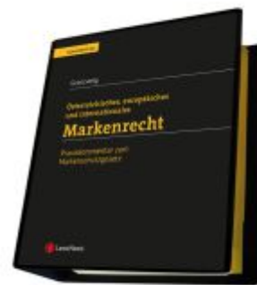
Markenrecht - Praxiskommentar zum Markenschutzgesetz Ladenpreis: 275,00EUR