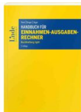
Handbuch für Einnahmen-Ausgaben-Rechner Ladenpreis: 59,00EUR