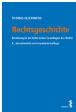
Rechtsgeschichte Ladenpreis: 49,00EUR