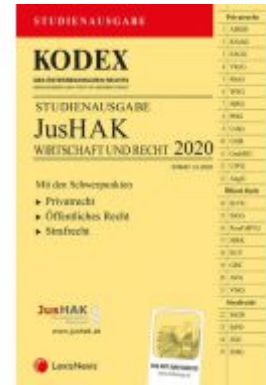
KODEX JusHAK Ladenpreis: 23,00 EUR