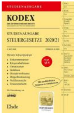
KODEX Studienausgabe Steuergesetze 2020/21 Ladenpreis: 15,00 EUR