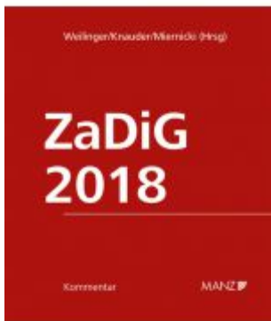
Kommentar zum Zahlungsdienstegesetz ZaDiG 2018 Aktionspreis: 198,00 EUR Ladenpreis: 239,00 EUR