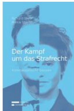
Der Kampf um das Strafrecht Ladenpreis: 25,00 EUR