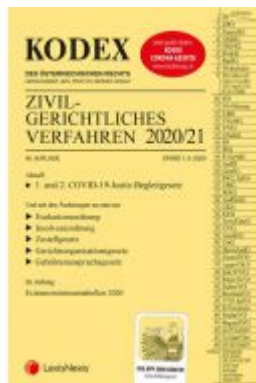
KODEX Zivilgerichtliches Verfahren 2020/21 Ladenpreis: 40,00 EUR