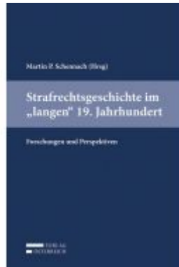
Strafrechtsgeschichte im "langen" 19. Jahrhundert Ladenpreis: 69,00 EUR