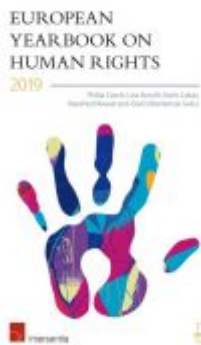
European Yearbook on Human Rights 2019 Ladenpreis: 89,00 EUR