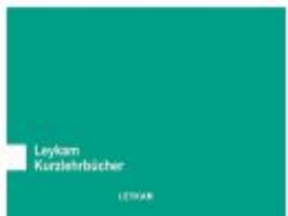
Gesetzeskunde für Pharmazeutinnen und Pharmazeuten 2. Auflage Ladenpreis: 26,50 EUR