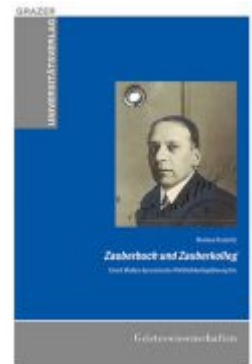
Zauberbuch und Zauberkolleg – Ernst Mallys dynamische Wirklichkeitsphilosophie Ladenpreis: 17,90 EUR