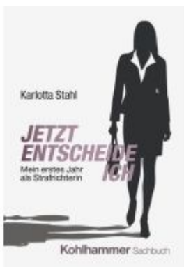
Jetzt entscheide ich Ladenpreis: 19,50EUR