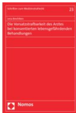
Die Vorsatzstrafbarkeit des Arztes bei konsentierten lebensgefährdenden Behandlungen Ladenpreis: 91,50EUR