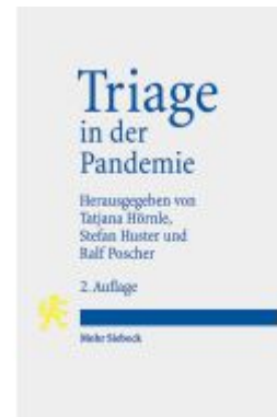
Triage in der Pandemie Ladenpreis: 35,00EUR