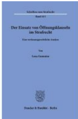
Der Einsatz von Öffnungsklauseln im Strafrecht. Ladenpreis: 92,50EUR