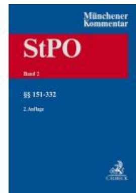
Münchener Kommentar zur Strafprozessordnung Bd. 2: §§ 151-332 StPO Ladenpreis: 307,40EUR