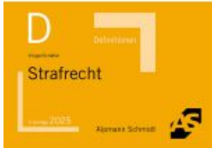
Definitionen Strafrecht Ladenpreis: 15,40EUR