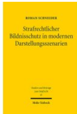
Strafrechtlicher Bildnisschutz in modernen Darstellungsszenarien Ladenpreis: 153,20EUR