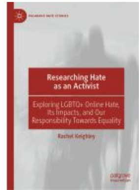
Researching Hate as an Activist Ladenpreis: 49,49EUR