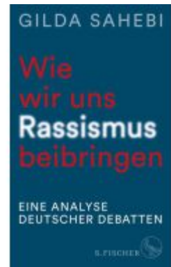
Wie wir uns Rassismus beibringen Ladenpreis: 26,80EUR