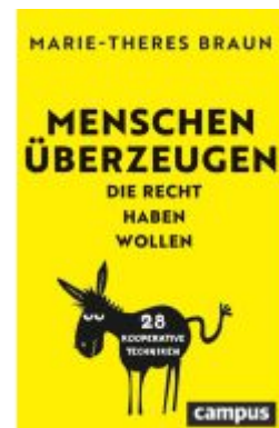
Menschen überzeugen, die Recht haben wollen Ladenpreis: 24,70EUR