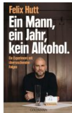
Ein Mann, ein Jahr, kein Alkohol. Ladenpreis: 18,50EUR