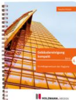
Gebäudereinigung kompakt Band 4 Ladenpreis: 19,80EUR