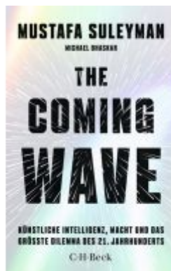
The Coming Wave Ladenpreis: 18,50EUR