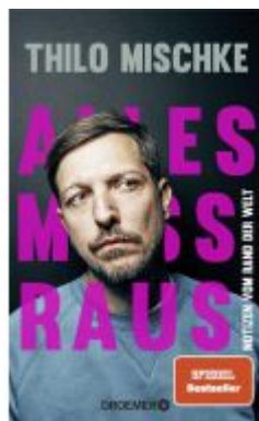
Alles muss raus Ladenpreis: 20,60EUR