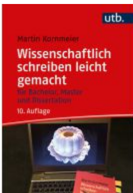
Wissenschaftlich schreiben leicht gemacht Ladenpreis: 18,50EUR