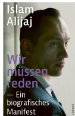
Wir müssen reden Ladenpreis: 29,90EUR