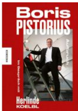
Boris Pistorius. Aufbruch Ladenpreis: 24,70EUR