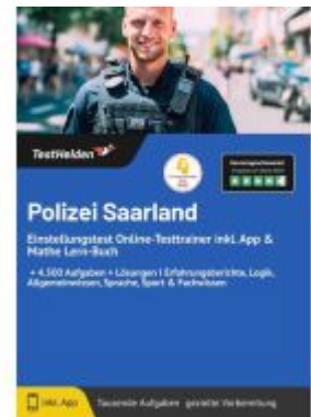
Polizei Saarland Einstellungstest Vorbereitung & Assessment Center bestehen: Online-Testtrainer inkl. App I + 5.000 Aufgaben mit Lösungen, Erfahrungsberichte, Austausch in Community uvm! Ladenpreis: 41,10EUR