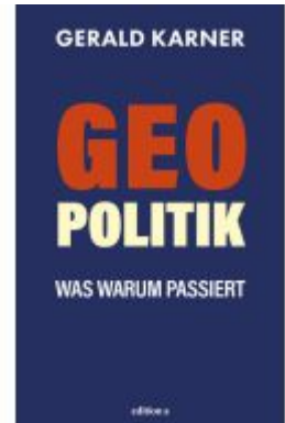
Geopolitik Ladenpreis: 25,00EUR