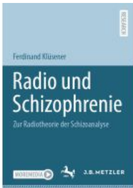
Radio und Schizophrenie Ladenpreis: 82,23EUR