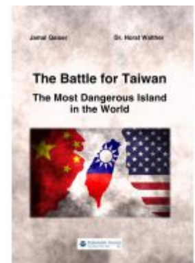
The Battle for Taiwan Ladenpreis: 20,60EUR