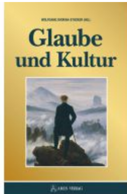
Glaube und Kultur Ladenpreis: 28,00EUR