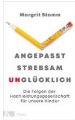
Angepasst, strebsam, unglücklich Ladenpreis: 20,60EUR