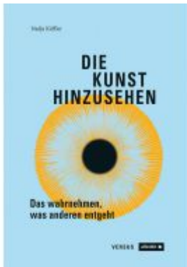
Die Kunst hinzusehen Ladenpreis: 32,90EUR