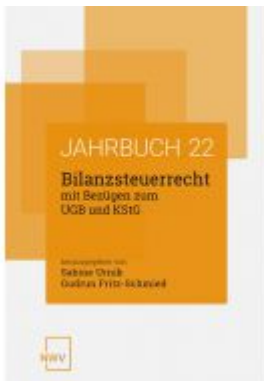
Bilanzsteuerrecht mit Bezügen zum UGB und KStG Ladenpreis: 62,00 EUR

Wir haben andere Produkte gefunden, die Ihnen gefallen könnten!