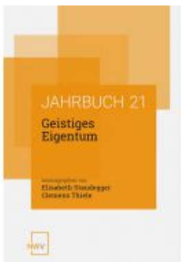
Geistiges Eigentum Ladenpreis: 68,00 EUR