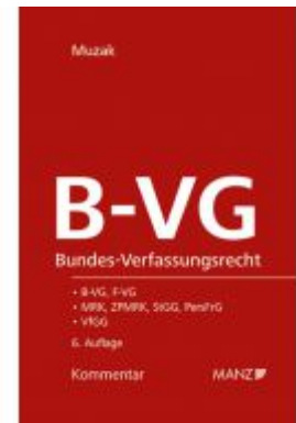
Bundes-Verfassungsrecht B-VG Ladenpreis: 194,00 EUR