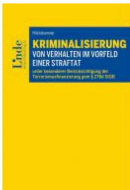
Kriminalisierung von Verhalten im Vorfeld einer Straftat Ladenpreis: 39,00 EUR