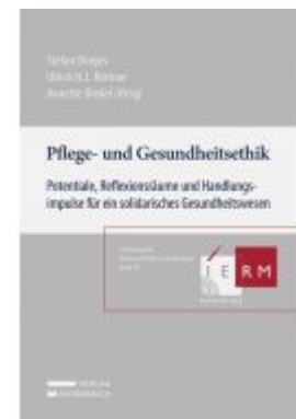
Pflege- und Gesundheitsethik Ladenpreis: 59,00 EUR