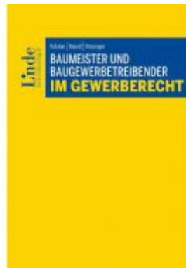
Baumeister und Baugewerbetreibender im Gewerberecht Ladenpreis: 44,00 EUR