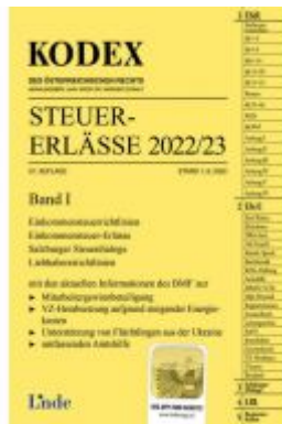
KODEX Steuer-Erlässe 2022/23, Band I Ladenpreis: 61,00 EUR