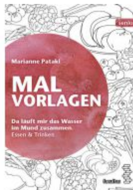
Malvorlagen Ladenpreis: 4,90 EUR