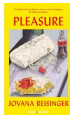
PLEASURE Ladenpreis: 22,70EUR