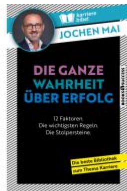
Die ganze Wahrheit über Erfolg Ladenpreis: 18,40EUR