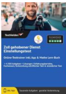
Zoll gehobener Dienst Einstellungstest: Online-Testtrainer inkl. App & Mathe Lern- Buch I + 4.500 Aufgaben + Lösungen I Erfahrungsberichte, Fachwissen, Vorbereitung schriftlicher Test & mündlicher Test Ladenpreis: 41,10EUR