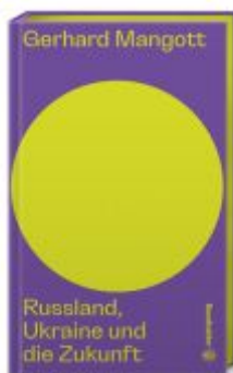
Russland, Ukraine und die Zukunft Ladenpreis: 22,00EUR