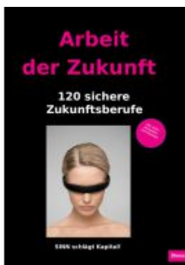
Arbeit der Zukunft Ladenpreis: 20,40EUR