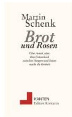
Brot und Rosen Ladenpreis: 12,00EUR