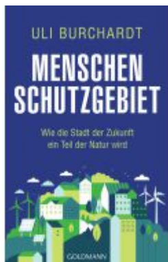
Menschenschutzgebiet Ladenpreis: 22,70EUR

Wir haben andere Produkte gefunden, die Ihnen gefallen könnten!