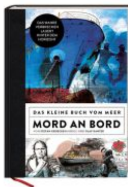
Mord an Bord - Das kleine Buch vom Meer Ladenpreis: 24,90EUR