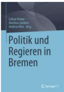
Politik und Regieren in Bremen Ladenpreis: 82,24EUR