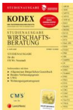
KODEX Wirtschaftsberatung 2020 Ladenpreis: 22,00 EUR