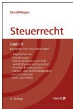
Grundriss des österreichischen Steuerrechts Ladenpreis: 68,00 EUR