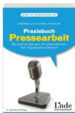
Praxisbuch Pressearbeit Ladenpreis: 18,40 EUR