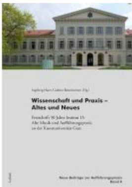
Wissenschaft und Praxis – Altes und Neues Ladenpreis: 19,90 EUR