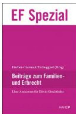
Liber Amicorum Edwin Gitschthaler Ladenpreis: 74,00 EUR