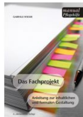
Das Fachprojekt für Angehörige von Sozialbetreuungsberufen Ladenpreis: 17,90 EUR