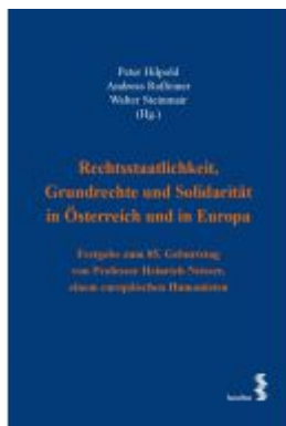
Rechtsstaatlichkeit, Grundrechte und Solidarität in Österreich und in Europa Ladenpreis: 250,00 EUR