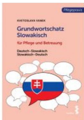
Grundwortschatz Slowakisch für Pflege- und Gesundheitsberufe Ladenpreis: 18,90 EUR