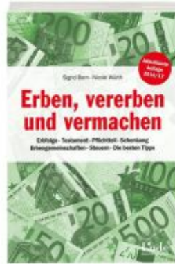
Erben, vererben und vermachen Ladenpreis: 12,90 EUR