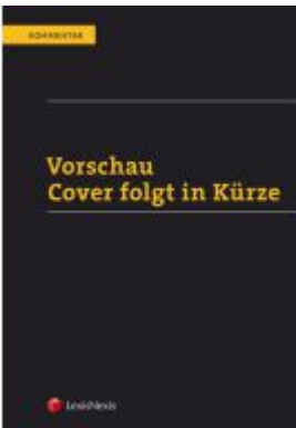
Kommentar zum Umweltrecht Band 2 Ladenpreis: 89,00 EUR