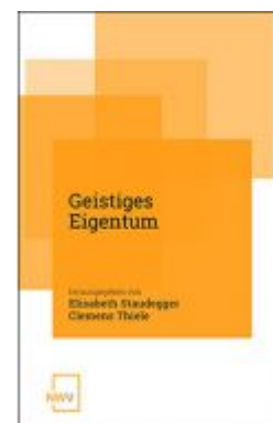
Geistiges Eigentum Ladenpreis: 68,00 EUR