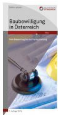
Baubewilligung in Österreich Ladenpreis: 27,50 EUR