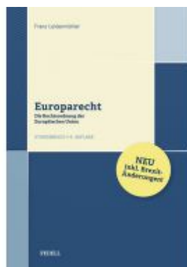
Europarecht Ladenpreis: 45,00 EUR