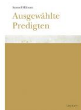
Samuel Mühsam. Ausgewählte Predigten Ladenpreis: 18,00 EUR