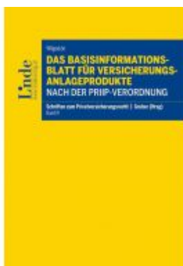
Das Basisinformationsblatt für Versicherungsanlageprodukte nach der PRIIP-Verordnung Ladenpreis: 48,00 EUR