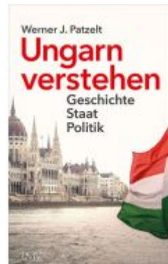
Ungarn verstehen Ladenpreis: 36,00EUR