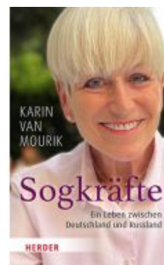
Sogkräfte Ladenpreis: 20,60EUR