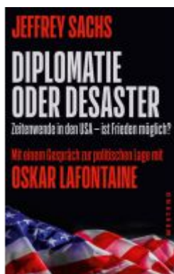
Diplomatie oder Desaster Ladenpreis: 20,60EUR