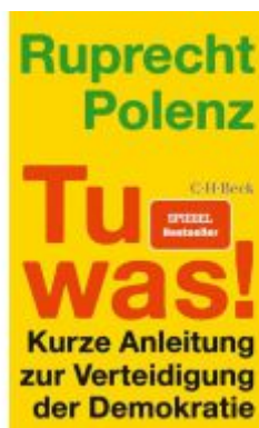
Tu was! Ladenpreis: 12,40EUR