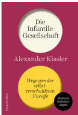
Die infantile Gesellschaft. Wege aus der selbstverschuldeten Unreife. AKTUALISIERTE AUSGABE Ladenpreis: 12,40EUR

Wir haben andere Produkte gefunden, die Ihnen gefallen könnten!