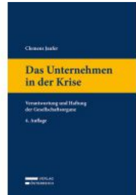
Das Unternehmen in der Krise Ladenpreis: 99,00EUR