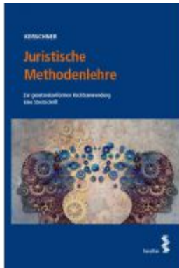
Juristische Methodenlehre Ladenpreis: 24,00EUR