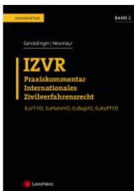
IZVR Praxiskommentar Internationales Zivilverfahrensrecht Ladenpreis: 139,00EUR