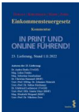
Einkommensteuergesetz Ladenpreis: 140,00EUR

Wir haben andere Produkte gefunden, die Ihnen gefallen könnten!