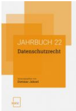
Datenschutzrecht Ladenpreis: 64,00EUR