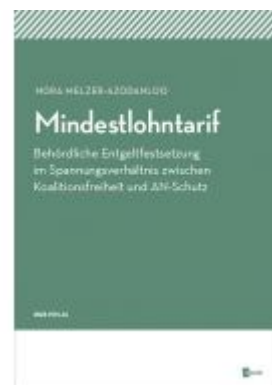
Mindestlohtarif Ladenpreis: 69,00EUR