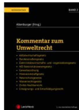
Kommentar zum Umweltrecht Band 2 Ladenpreis: 197,00EUR