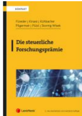
Die steuerliche Forschungsprämie Ladenpreis: 54,00EUR