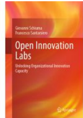
Open Innovation Labs