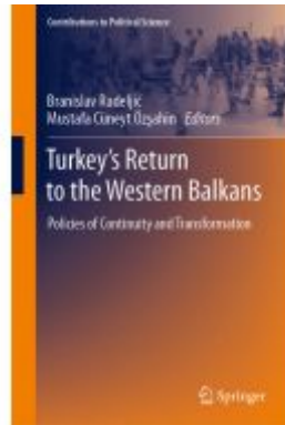
Turkey's Return to the Western Balkans