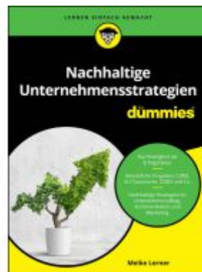
Nachhaltige Unternehmensstrategien für Dummies Ladenpreis: 26,80EUR