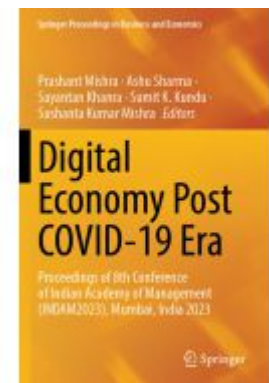
Digital Economy Post COVID-19 Era Ladenpreis: 197,99EUR