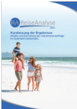
Reiseanalyse 2023: Kurzfassung der Ergebnisse