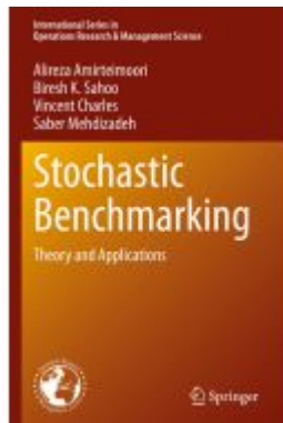
Stochastic Benchmarking Ladenpreis: 71,49EUR

Wir haben andere Produkte gefunden, die Ihnen gefallen könnten!