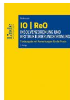
IO | ReO Insolvenzordnung und Restrukturierungsordnung Ladenpreis: 89,00 EUR