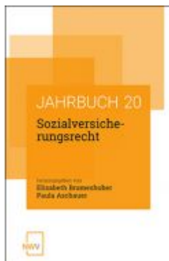
Sozialversicherungsrecht Ladenpreis: 62,00 EUR

Wir haben andere Produkte gefunden, die Ihnen gefallen könnten!