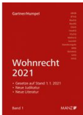
Wohnrecht 2021 Ladenpreis: 44,00 EUR