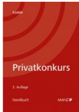
Handbuch Privatkonkurs Ladenpreis: 105,00 EUR