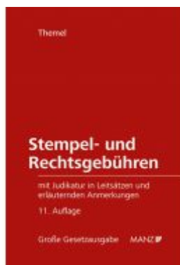
Stempel- und Rechtsgebühren Ladenpreis: 138,00 EUR