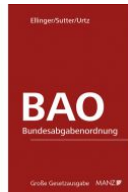
Bundesabgabenordnung - BAO Ladenpreis: 348,00 EUR