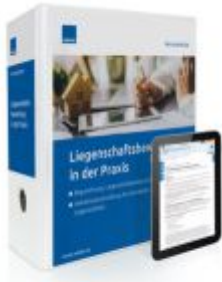
Liegenschaftsbewertung in der Praxis Ladenpreis: 217,80 EUR