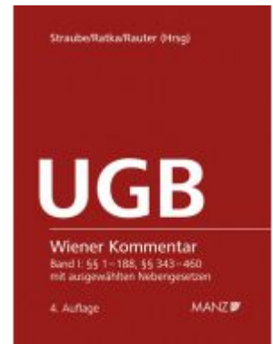
Wiener Kommentar zum UGB 4. Auflage Ladenpreis: 368,00 EUR