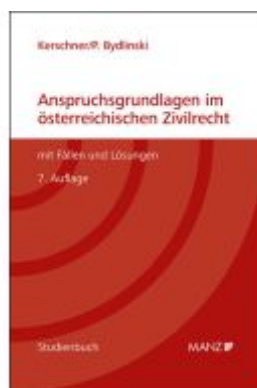
Anspruchsrundlagen im österreichischen Zivilrecht mit Fällen und Lösungen