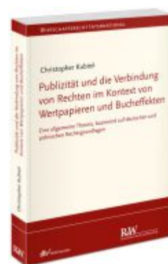
Publizität und die Verbindung von Rechten im Kontext von Wertpapieren und Bucheffekten Ladenpreis: 91,50EUR