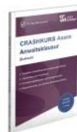
CRASHKURS Assex Anwaltsklausur Ladenpreis: 25,60EUR