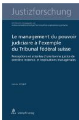
Le management du pouvoir judiciaire à l'exemple du Tribunal fédéral suisse