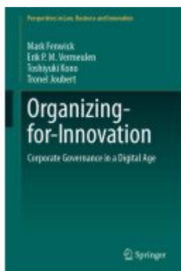
Organizing-for-Innovation Ladenpreis: 142,99EUR