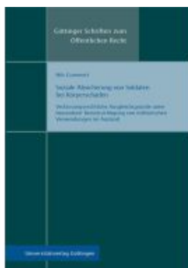
Soziale Absicherung von Soldaten bei Körperschäden Ladenpreis: 39,10EUR