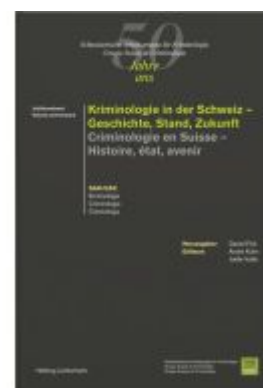
Kriminologie in der Schweiz - Geschichte, Stand, Zukunft - Criminologie en Suisse - Histoire, état, avenir