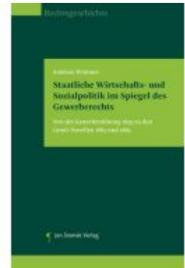
Staatliche Wirtschafts- und Sozialpolitik im Spiegel des Gewerberechts Ladenpreis: 49,90EUR