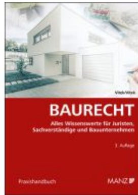
Baurecht Ladenpreis: 48,00EUR