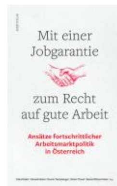
Mit einer Jobgarantie zum Recht auf gute Arbeit Ladenpreis: 19,90EUR