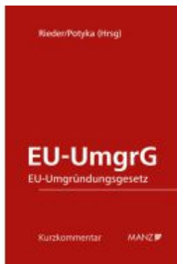
EU-Umründungsgesetz Ladenpreis: 118,00EUR