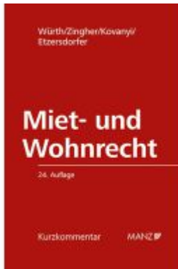
PAKET: Miet- und Wohnrecht 24. Auflage Ladenpreis: 258,00EUR