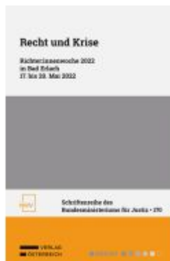
Recht und Krise Ladenpreis: 48,00EUR

Wir haben andere Produkte gefunden, die Ihnen gefallen könnten!