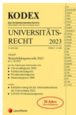
KODEX Universitätsrecht 2023 Ladenpreis: 62,00EUR