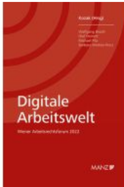
Digitale Arbeitswelt Ladenpreis: 34,00EUR