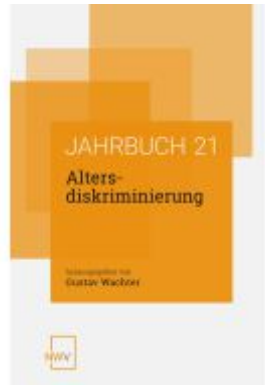
Altersdiskriminierung Ladenpreis: 64,00EUR