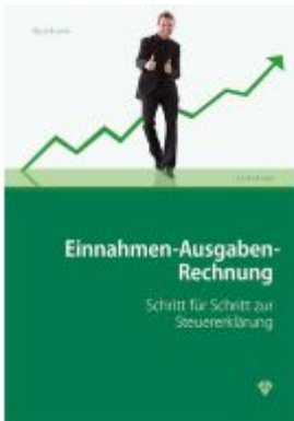
Einnahmen-Ausgaben-Rechnung Ladenpreis: 28,00EUR