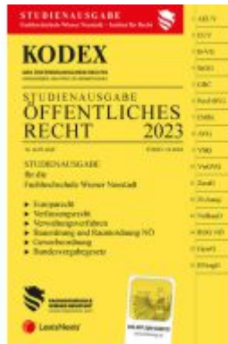
KODEX Öffentliches Recht 2023 - inkl. App Ladenpreis: 21,50EUR