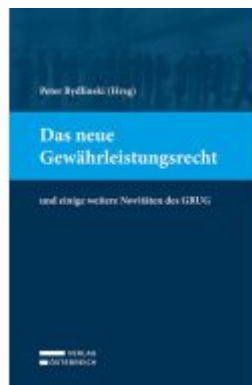
Das neue Gewährleistungsrecht Ladenpreis: 59,00EUR