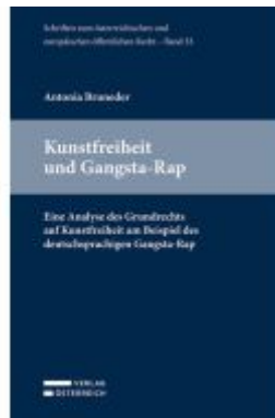
Kunstfreiheit und Gangsta-Rap Ladenpreis: 54,00EUR