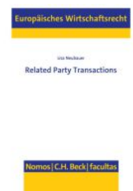
Related Party Transactions Ladenpreis: 101,80EUR