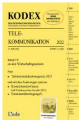
KODEX Telekommunikation 2022 Ladenpreis: 83,00EUR