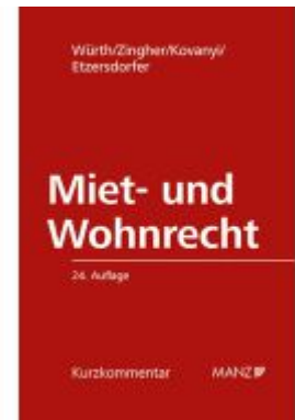
Miet- und Wohnrecht Ladenpreis: 178,00EUR