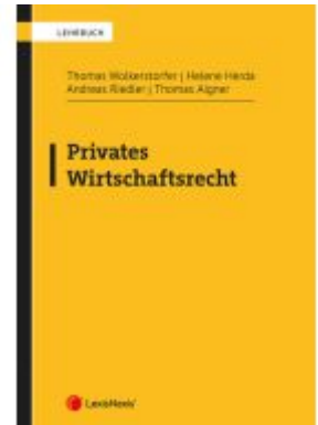
Privates Wirtschaftsrecht Ladenpreis: 42,00EUR