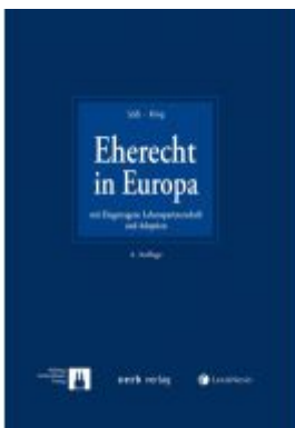
Eherecht in Europa Ladenpreis: 169,00 EUR