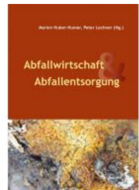
Abfallwirtschaft & Abfallentsorgung Ladenpreis: 28,00 EUR