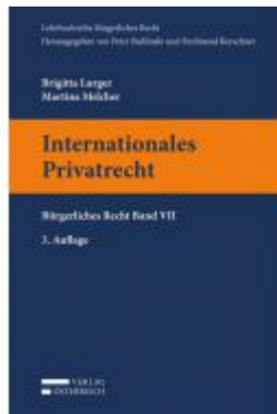
Internationales Privatrecht Ladenpreis: 29,00 EUR

Wir haben andere Produkte gefunden, die Ihnen gefallen könnten!