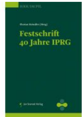
Festschrift 40 Jahre IPRG Ladenpreis: 98,00 EUR