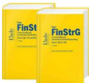
FinStrG | Finanzstrafgesetz - Paket Bd. 1+2 Ladenpreis: 348,00 EUR