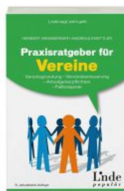
Praxisratgeber für Vereine Ladenpreis: 24,90 EUR