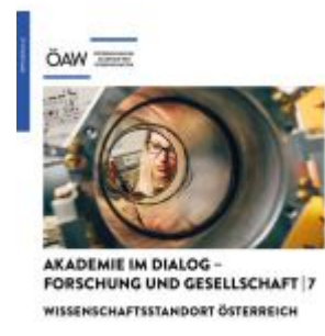
Wissenschaftsstandort Österreich Ladenpreis: 9,90EUR