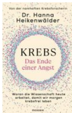
Krebs - Das Ende einer Angst Ladenpreis: 24,70EUR