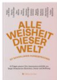
Alle Weisheit dieser Welt ist schon lange ausgesprochen Ladenpreis: 24,70EUR