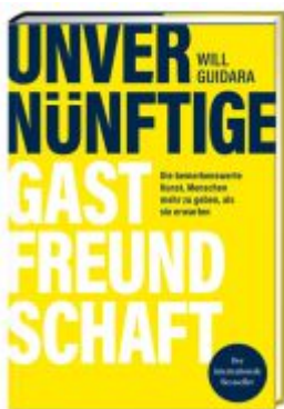
Unvernünftige Gastfreundschaft Ladenpreis: 28,80EUR