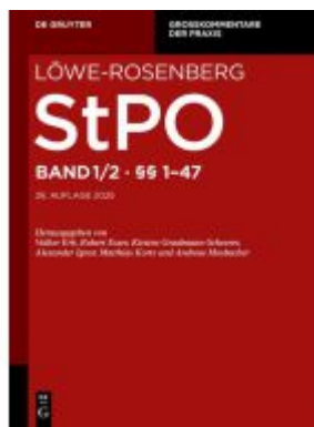
§§ 1-47 Ladenpreis: 179,95EUR