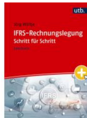
IFRS-Rechnungslegung Schritt für Schritt Ladenpreis: 30,80EUR