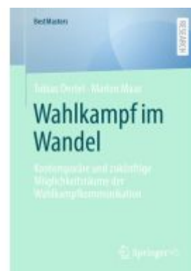
Wahlkampf im Wandel Ladenpreis: 71,95EUR