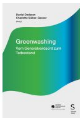
Greenwashing Ladenpreis: 74,20EUR