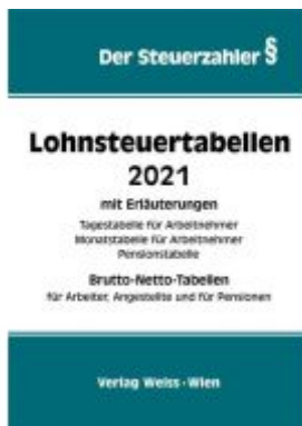
Lohnsteuertabellen 2021 Ladenpreis: 34,10 EUR