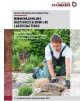
Normensammlung Gartengestaltung und Landschaftsbau Ladenpreis: 361,90 EUR