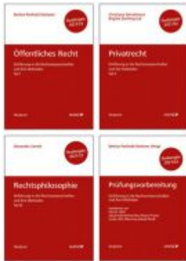
PAKET: Prüfungsvorbereitung + Einführung in die Rechtswissenschaften und ihre Methoden: Tl. I + Tl. II + Tl. III Ladenpreis: 44,00 EUR