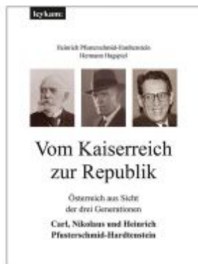
Vom Kaiserreich zur Republik Ladenpreis: 49,00 EUR