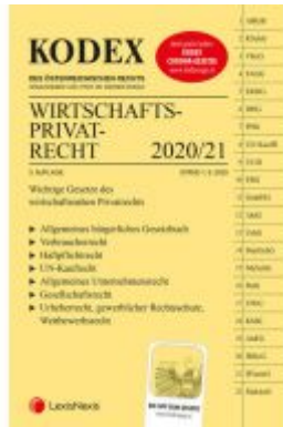
KODEX Wirtschaftsprivatrecht 2020/21 Ladenpreis: 29,80 EUR