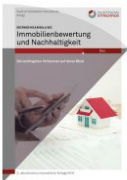
Normensammlung Immobilienbewertung und Nachhaltigkeit Ladenpreis: 306,90 EUR