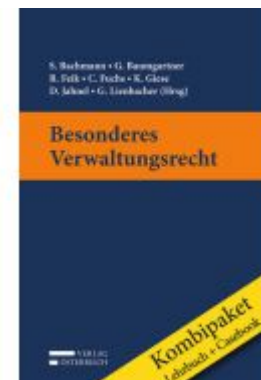
Kombipaket Besonderes Verwaltungsrecht Ladenpreis: 78,00 EUR