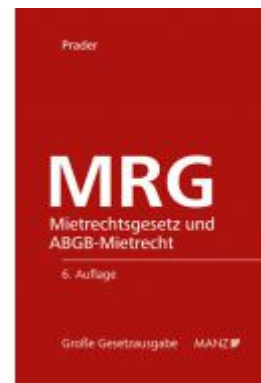
MRG - Mietrechtsgesetz und ABGB- Mietrecht Ladenpreis: 194,00 EUR