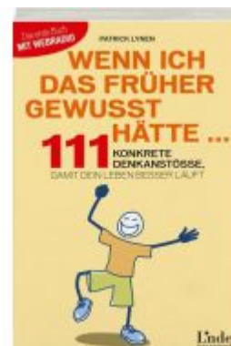
Wenn ich das früher gewusst hätte ... Ladenpreis: 14,95 EUR