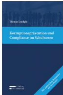
Korruptionsprävention und Compliance im Schulwesen Ladenpreis: 39,00 EUR