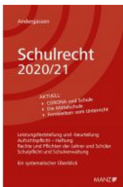
Schulrecht 2020/21 Ladenpreis: 38,00 EUR