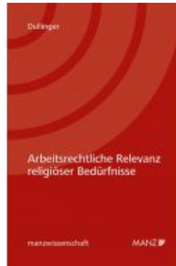
Arbeitsrechtliche Relevanz religiöser Bedürfnisse Ladenpreis: 74,00 EUR