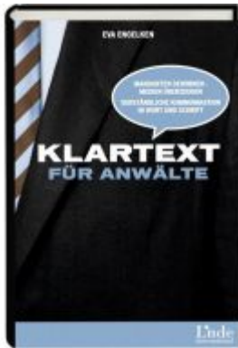
Klartext für Anwälte Ladenpreis: 25,60 EUR