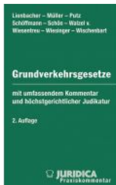
Die Grundverkehrsgesetze der österreichischen Bundesländer Ladenpreis: 225,00 EUR