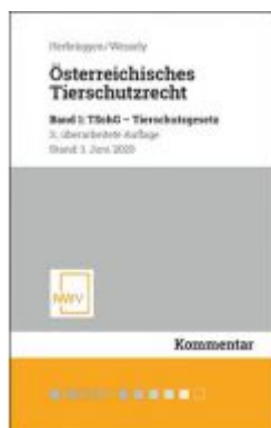
Österreichisches Tierschutzrecht Ladenpreis: 98,00 EUR