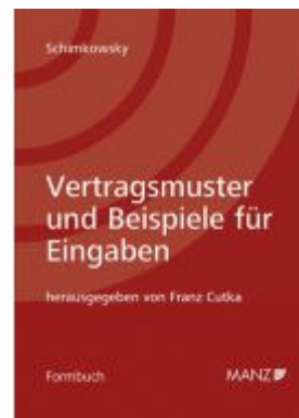
Vertragsmuster und Beispiele für Eingaben 9. Auflage Ladenpreis: 398,00EUR