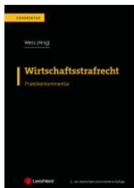
Wirtschaftsstrafrecht Ladenpreis: 329,00EUR