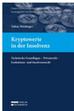
Kryptowerte in der Insolvenz Ladenpreis: 89,00EUR