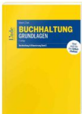
Buchhaltung Grundlagen Ladenpreis: 49,00EUR

Wir haben andere Produkte gefunden, die Ihnen gefallen könnten!