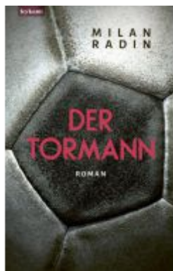
Der Tormann - Nominiert zum Fußballbuch des Jahres 2022 Ladenpreis: 21,00EUR