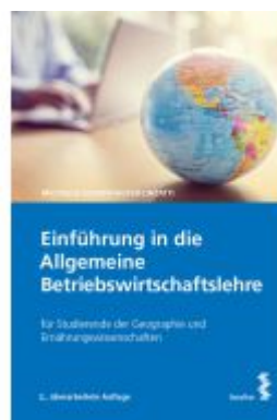
Einführung in die Allgemeine Betriebswirtschaftslehre Ladenpreis: 26,00EUR