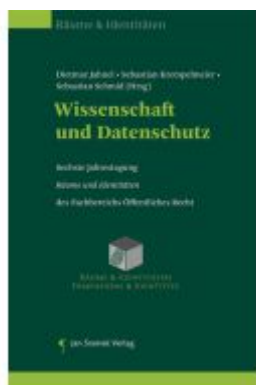
Wissenschaft und Datenschutz Ladenpreis: 55,00EUR