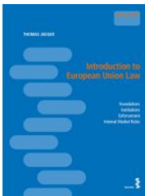
Introduction to European Union Law Ladenpreis: 24,00EUR