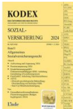
KODEX Sozialversicherung 2024, Band I Ladenpreis: 46,00EUR