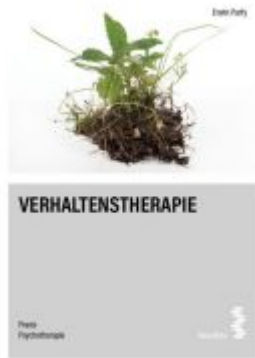
Verhaltenstherapie Ladenpreis: 16,90EUR