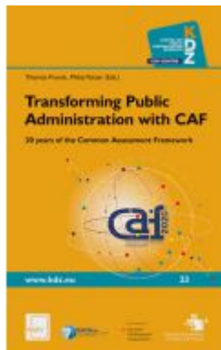
Transforming Public Administration with CAF Ladenpreis: 46,80EUR