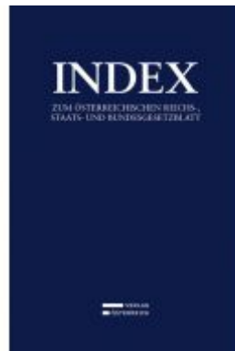
Index Ladenpreis: 499,00EUR