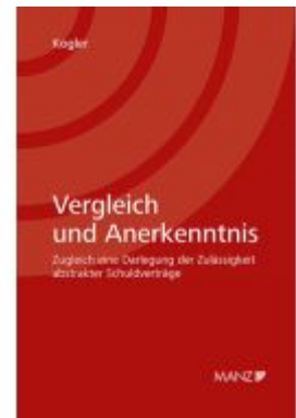
Vergleich und Anerkenntnis Ladenpreis: 84,00EUR