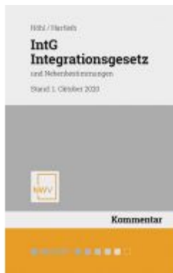
IntG Integrationsgesetz Ladenpreis: 68,00EUR