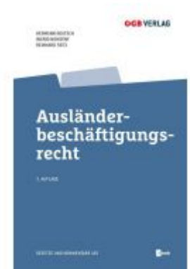
Ausländerbeschäftigungsrecht Ladenpreis: 89,00EUR