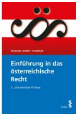
Einführung in das österreichische Recht Ladenpreis: 25,00EUR