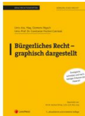
Bürgerliches Recht - graphisch dargestellt (Skriptum) Ladenpreis: 28,75EUR