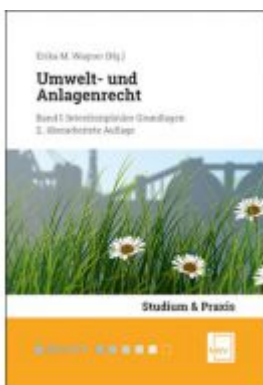
Umwelt- und Anlagenrecht Ladenpreis: 68,00 EUR