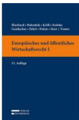
Europäisches und öffentliches Wirtschaftsrecht I Ladenpreis: 39,00 EUR