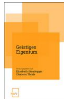
Geistiges Eigentum Ladenpreis: 68,00 EUR