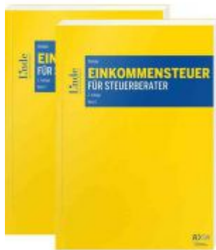
Einkommensteuer für Steuerberater Ladenpreis: 68,00 EUR