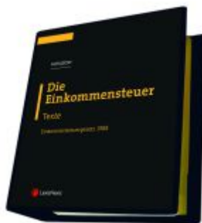
Die Einkommensteuer (EStG 1988) Band I - Texte Ladenpreis: 298,00 EUR