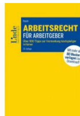
Arbeitsrecht für Arbeitgeber Ladenpreis: 97,00 EUR