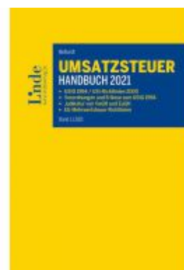
Umsatzsteuer-Handbuch 2021 Ladenpreis: 145,00 EUR