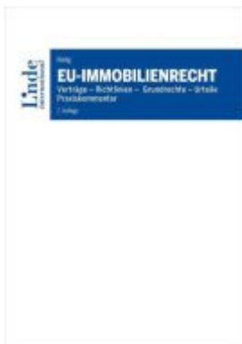
EU-Immobilienrecht Ladenpreis: 52,00EUR