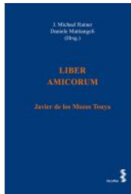
LIBER AMICORUM Ladenpreis: 44,00EUR