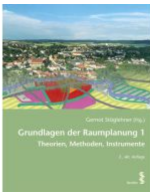
Grundlagen der Raumplanung 1 Ladenpreis: 32,00EUR