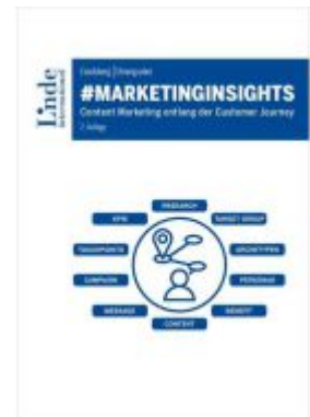
#marketinginsights Ladenpreis: 39,00EUR