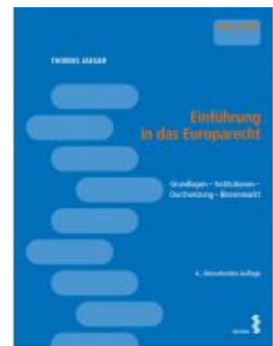
Einführung in das Europarecht Ladenpreis: 27,00EUR