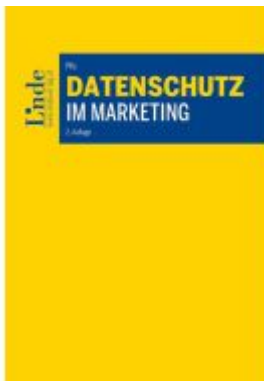
Datenschutz im Marketing Ladenpreis: 44,00EUR

Wir haben andere Produkte gefunden, die Ihnen gefallen könnten!