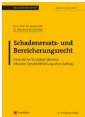
Bürgerliches Recht - Schadenersatz- und Bereicherungsrecht (Skriptum) Ladenpreis: 22,50EUR