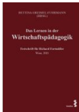
Das Lernen in der Wirtschaftspädagogik Ladenpreis: 34,00EUR