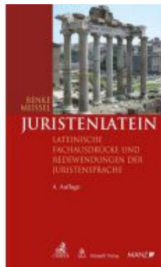
Juristenlatein Ladenpreis: 47,30EUR