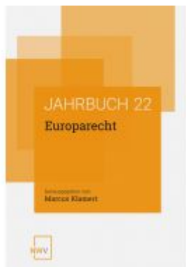
Europarecht Ladenpreis: 78,00 EUR