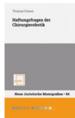
Haftungsfragen der Chirurgierobotik Ladenpreis: 54,00 EUR