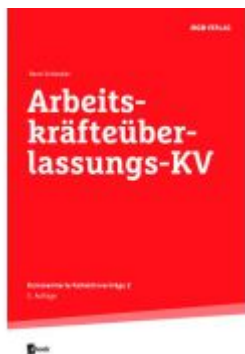
Arbeitskräfteüberlassungs-KV Ladenpreis: 36,00 EUR