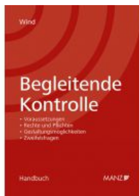
Begleitende Kontrolle Ladenpreis: 94,00 EUR