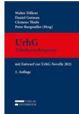
UrhG Urheberrechtsgesetz mit Entwurf zur UrhG-Novelle 2021 3. Auflage Ladenpreis: 349,00 EUR