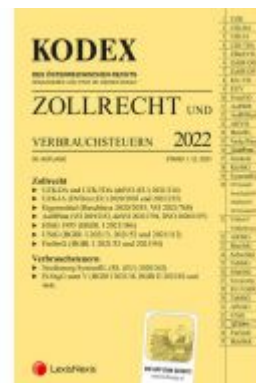
KODEX Zollrecht 2022 - inkl. App Ladenpreis: 116,00 EUR