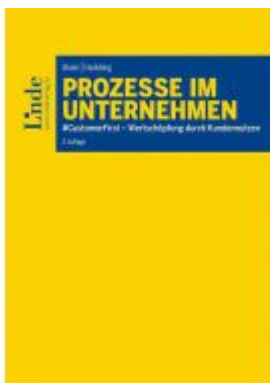
Prozesse im Unternehmen Ladenpreis: 39,00 EUR