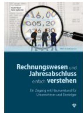
Rechnungswesen und Jahresabschluss einfach verstehen Ladenpreis: 36,00 EUR