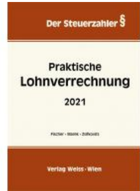
Praktische Lohnverrechnung 2021 Ladenpreis: 58,30 EUR