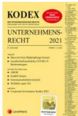
KODEX Unternehmensrecht 2021 Ladenpreis: 37,50 EUR

Wir haben andere Produkte gefunden, die Ihnen gefallen könnten!