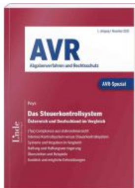
AVR-Spezial Das Steuerkontrollsystem Ladenpreis: 40,00 EUR