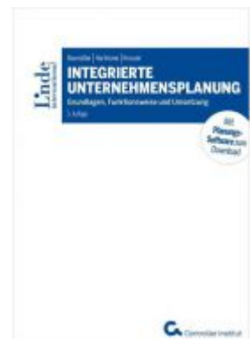
Integrierte Unternehmensplanung Ladenpreis: 65,00 EUR