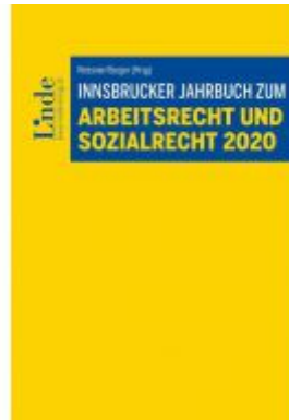
Innsbrucker Jahrbuch zum Arbeits- und Sozialrecht 2020 Ladenpreis: 52,00 EUR