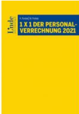
1 x 1 der Personalverrechnung 2021 Ladenpreis: 36,00 EUR