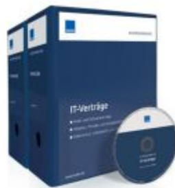
Mustersammlung IT-Verträge Ladenpreis: 249,90 EUR