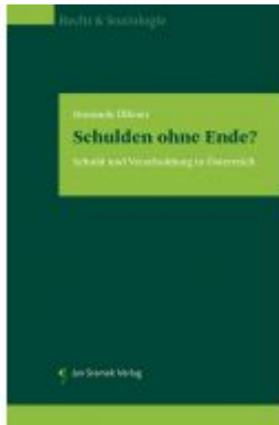
Schulden ohne Ende? Ladenpreis: 85,00 EUR