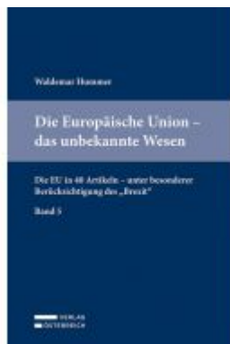
Die Europäische Union - das unbekannte Wesen Ladenpreis: 54,00 EUR