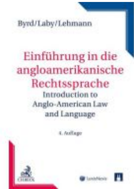
Einführung in die anglo-amerikanische Rechtssprache Ladenpreis: 39,00 EUR