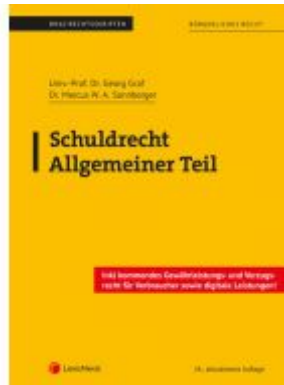
Schuldrecht Allgemeiner Teil (Skriptum) Ladenpreis: 18,00 EUR