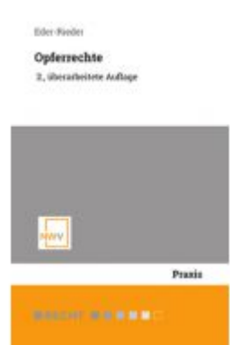
Opferrechte Ladenpreis: 48,00 EUR