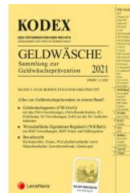
KODEX Finanzmarktrecht Band V inkl. App Ladenpreis: 60,00 EUR