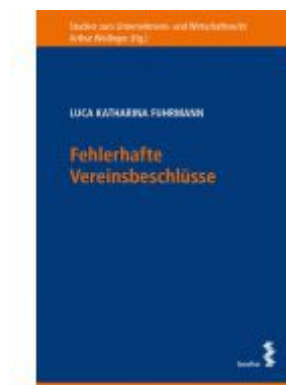
Fehlerhafte Vereinsbeschlüsse Ladenpreis: 38,00 EUR