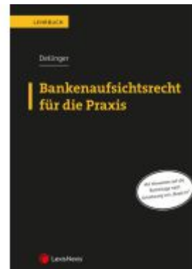
Bankenaufsichtsrecht für die Praxis Ladenpreis: 59,00EUR