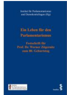
Ein Leben für den Parlamentarismus Ladenpreis: 160,00EUR