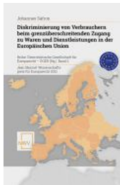
Diskriminierung von Verbrauchern beim grenzüberschreitenden Zugang zu Waren und Dienstleistungen in der Europäischen Union Ladenpreis: 88,00EUR