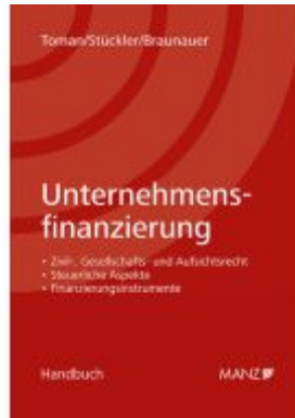
Unternehmensfinanzierung Ladenpreis: 69,00EUR