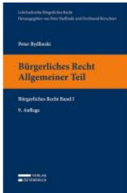
Bürgerliches Recht I. Allgemeiner Teil Ladenpreis: 33,00EUR