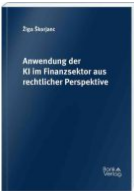
Anwendung der KI im Finanzsektor aus rechtlicher Perspektive Ladenpreis: 69,00EUR