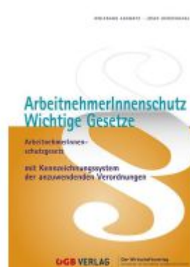
ArbeitnehmerInnenschutz. Ladenpreis: 72,80EUR