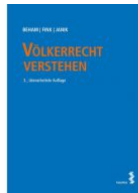
Völkerrecht verstehen Ladenpreis: 34,00 EUR