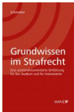
Grundwissen im Strafrecht