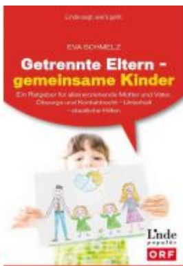
Getrennte Eltern - gemeinsame Kinder Ladenpreis: 24,90 EUR