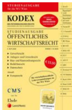
KODEX Öffentliches Wirtschaftsrecht 2020/21 Ladenpreis: 15,50 EUR