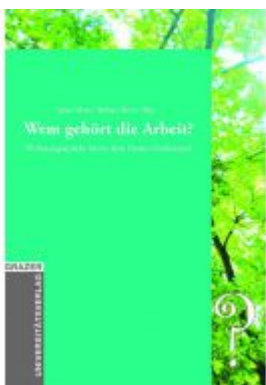
Wem gehört die Arbeit? Ladenpreis: 18,90 EUR