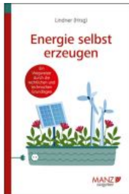
Energie selbst erzeugen Ladenpreis: 23,80EUR

Wir haben andere Produkte gefunden, die Ihnen gefallen könnten!