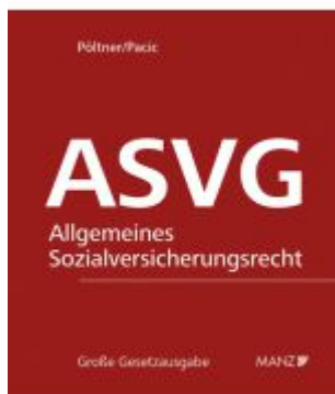
Allgemeine Sozialversicherung ASVG Ladenpreis: 338,00EUR