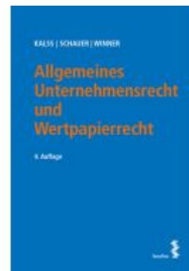
Allgemeines Unternehmensrecht und Wertpapierrecht Ladenpreis: 54,00EUR