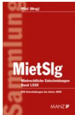
Mietrechtliche Entscheidungen MietSlg Ladenpreis: 229,00EUR