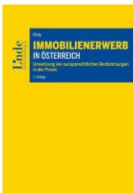
Immobilienwerb in Österreich Ladenpreis: 60,00EUR