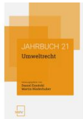
Umweltrecht Ladenpreis: 54,80EUR