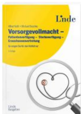
Vorsorgevollmacht - Patientenverfügung - Sterbeverfügung - Erwachsenenvertretung Ladenpreis: 22,00EUR