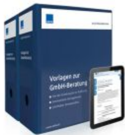
Vorlagen zur GmbH-Beratung Ladenpreis: 250,80EUR