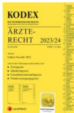
KODEX Ärztrecht 2023/24 - inkl. App Ladenpreis: 99,00EUR