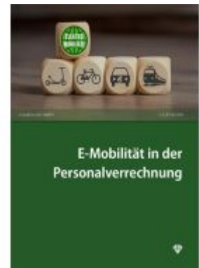
E-Mobilität in der Personalverrechnung Ladenpreis: 25,00EUR