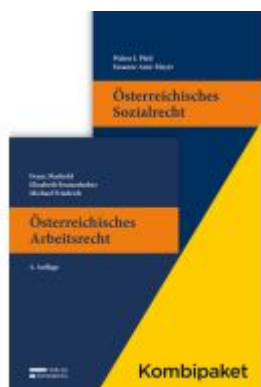
Kombipaket Österreichisches Arbeitsrecht und Österreichisches Sozialrecht Ladenpreis: 104,00EUR