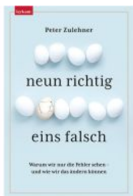
Neun richtig, eins falsch. Ladenpreis: 22,00EUR