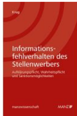
Informationsfehlverhalten des Stellenwerbers Ladenpreis: 76,00EUR