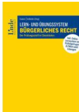
Lern- und Übungssystem Bürgerliches Recht Ladenpreis: 50,00EUR