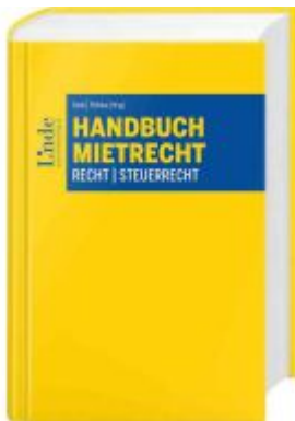
Handbuch Mietrecht Ladenpreis: 160,00EUR

Wir haben andere Produkte gefunden, die Ihnen gefallen könnten!