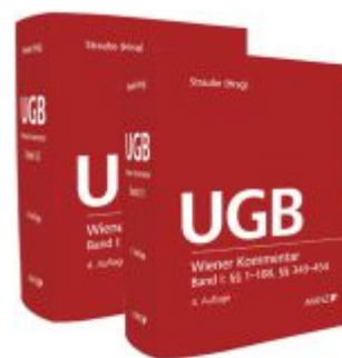
Wiener Kommentar zum UGB PAKET Band 1 + Band 2 Ladenpreis: 578,00EUR