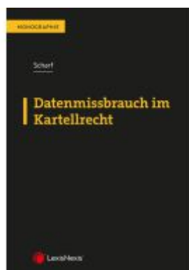
Datenmissbrauch im Kartellrecht Ladenpreis: 59,00EUR