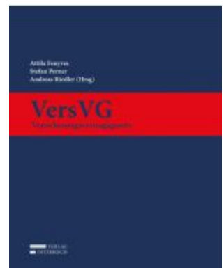
VersVG - Versicherungsvertragsgesetz Ladenpreis: 109,00EUR