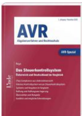
AVR-Spezial Das Steuerkontrollsystem Ladenpreis: 40,00 EUR