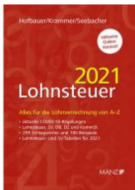
Lohnsteuer 2021 Ladenpreis: 59,00 EUR