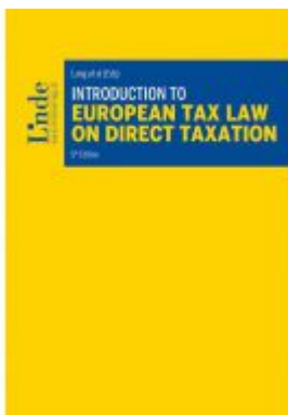
Introduction to European Tax Law on Direct Taxation Ladenpreis: 54,00 EUR

Wir haben andere Produkte gefunden, die Ihnen gefallen könnten!