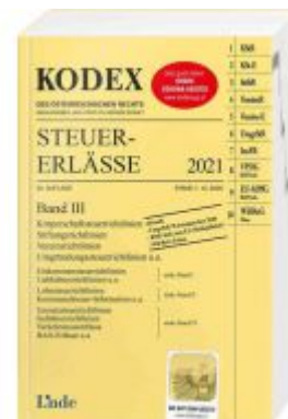
KODEX Steuer-Erlässe 2021 Band III Ladenpreis: 60,00 EUR