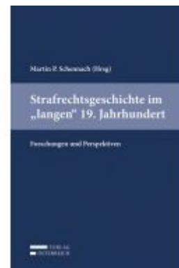
Strafrechtsgeschichte im "langen" 19. Jahrhundert Ladenpreis: 69,00 EUR