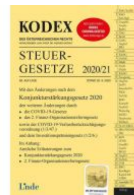
KODEX Steuergesetze 2020/21 Ladenpreis: 39,00 EUR