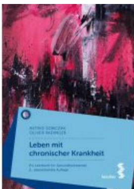
Leben mit chronischer Krankheit Ladenpreis: 24,90EUR

Wir haben andere Produkte gefunden, die Ihnen gefallen könnten!