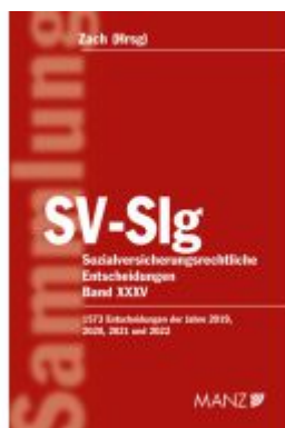
Sozialversicherungsrechtliche Entscheidungen SV-Slg Ladenpreis: 340,00EUR