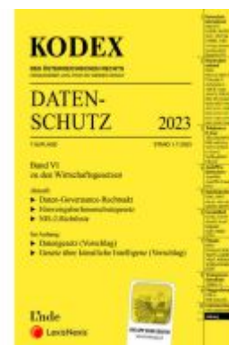
KODEX Datenschutz 2023 Ladenpreis: 68,00EUR