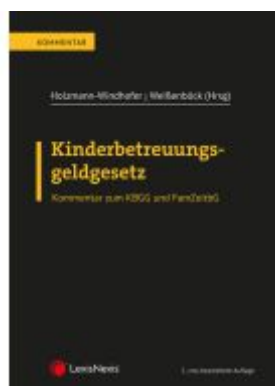
Kinderbetreuungsgeldgesetz Ladenpreis: 82,00EUR