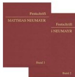
Festschrift Matthias Neumayr Ladenpreis: 498,00EUR