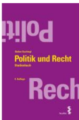
Politik und Recht Ladenpreis: 19,60EUR