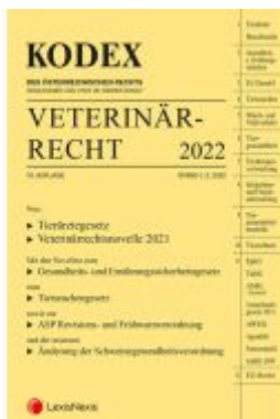
KODEX Veterinärrecht 2022 Ladenpreis: 96,00EUR