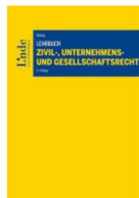
Lehrbuch Zivil-, Unternehmens- und Gesellschaftsrecht Ladenpreis: 55,00EUR