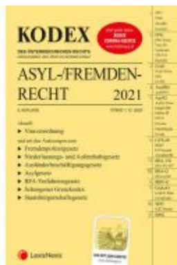
KODEX Asyl- und Fremdenrecht 2021 Ladenpreis: 48,00 EUR