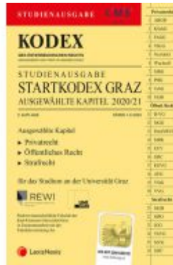
KODEX Startkodex Graz 2020/21 Ladenpreis: 19,00 EUR