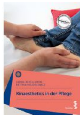
Kinaesthetics in der Pflege Ladenpreis: 29,90 EUR