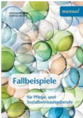
Fallbeispiele für Pflege- und Sozialbetreuungsberufe Ladenpreis: 19,90 EUR