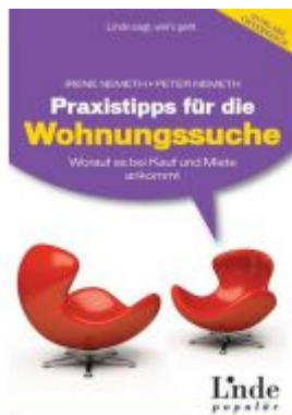
Praxistipps für die Wohnungssuche Ladenpreis: 19,90 EUR