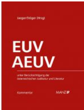
Kommentar zu EUV und AEUV Ladenpreis: 384,00 EUR