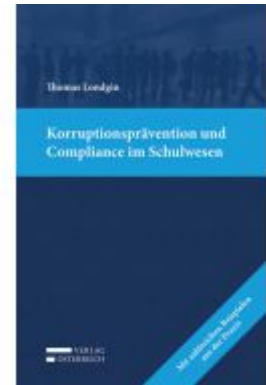
Korruptionsprävention und Compliance im Schulwesen Ladenpreis: 39,00 EUR