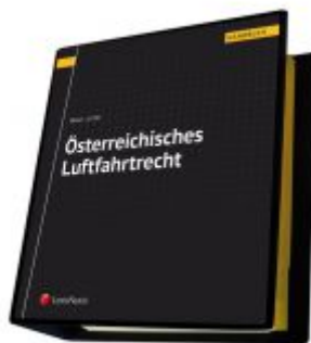
Österreichisches Luftfahrtrecht Ladenpreis: 460,00 EUR