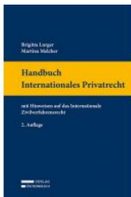
Handbuch Internationales Privatrecht Ladenpreis: 119,00 EUR