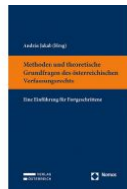
Methoden und theoretische Grundfragen des österreichischen Verfassungsrechts Ladenpreis: 59,00 EUR