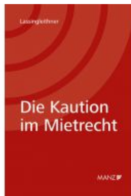
Die Kautio im Mietrecht Ladenpreis: 52,00 EUR