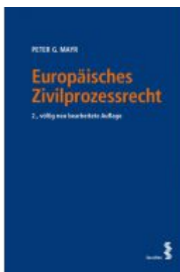
Europäisches Zivilprozessrecht Ladenpreis: 58,00 EUR