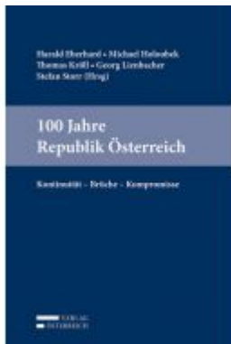
100 Jahre Republik Österreich Ladenpreis: 98,00 EUR

Wir haben andere Produkte gefunden, die Ihnen gefallen könnten!