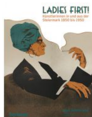
Ladies First! Künstlerinnen in und aus der Steiermark 1850–1950 Ladenpreis: 30,00 EUR