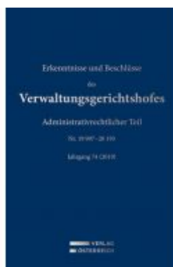
Erkenntnisse und Beschlüsse des Verwaltungsgerichtshofes Ladenpreis: 419,00 EUR