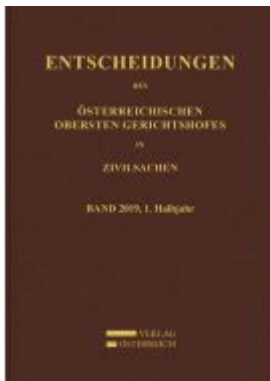
Entscheidungen des Obersten Gerichtshofes in Zivilsachen Ladenpreis: 198,00 EUR

Wir haben andere Produkte gefunden, die Ihnen gefallen könnten!