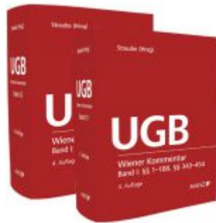
Wiener Kommentar zum UGB PAKET Band 1 + Band 2 Ladenpreis: 548,00 EUR