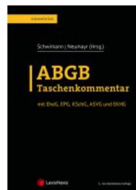
ABGB Taschenkommentar Ladenpreis: 319,00 EUR