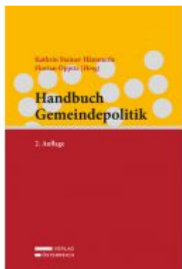
Handbuch Gemeindepolitik Ladenpreis: 68,00 EUR