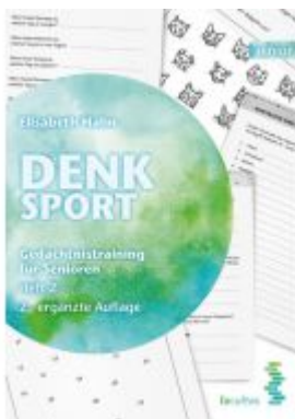
Denksport Ladenpreis: 14,90 EUR