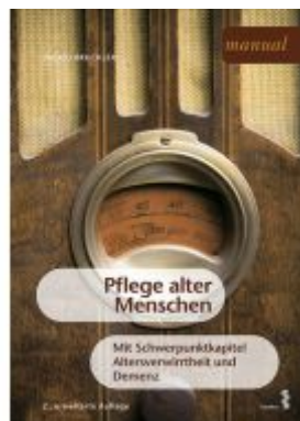
Pflege alter Menschen Ladenpreis: 9,90 EUR