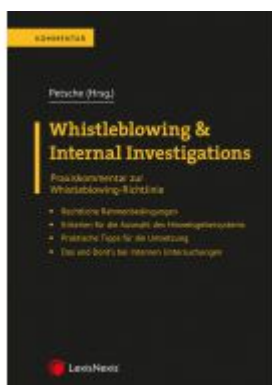
Whistleblowing & Internal Investigations Ladenpreis: 49,00 EUR