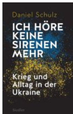
Ich höre keine Sirenen mehr Ladenpreis: 24,70EUR