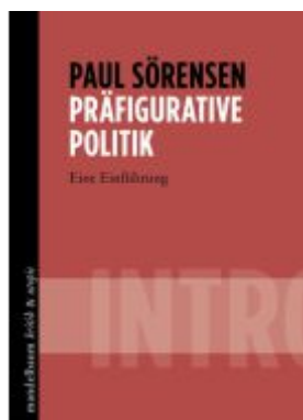
Präfigurative Politik Ladenpreis: 14,00EUR