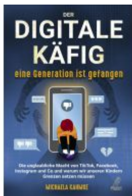
Der digitale Käfig - Eine Generation ist gefangen Ladenpreis: 20,99EUR