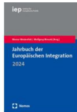
Jahrbuch der Europäischen Integration 2024 Ladenpreis: 101,80EUR