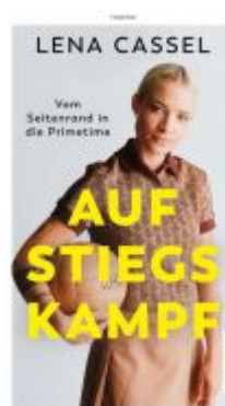
Aufstiegskampf Ladenpreis: 18,50EUR