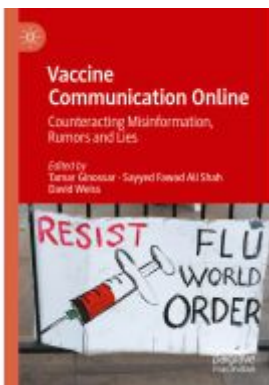
Vaccine Communication Online Ladenpreis: 142,99EUR