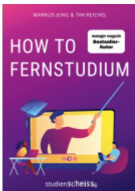
How to Fernstudium Ladenpreis: 19,99EUR

Wir haben andere Produkte gefunden, die Ihnen gefallen könnten!