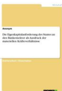
Die Eigenkapitalanforderung des Staates an den Bankensektor als Ausdruck der materiellen Kräfteverhältnisse Ladenpreis: 52,95EUR