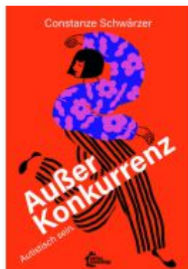
Außer Konkurrenz Ladenpreis: 17,30EUR