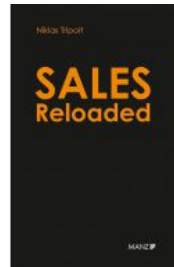
Sales Reloaded Komplexe Projekte in drei Phasen erfolgreich verkaufen Ladenpreis: 24,90 EUR