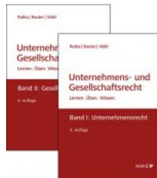
PAKET: Unternehmensrecht + Gesellschaftsrecht Ladenpreis: 97,00 EUR