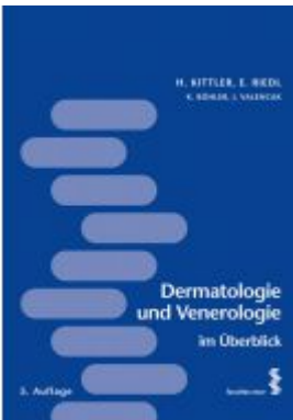
Dermatologie und Venerologie im Überblick Ladenpreis: 18,50 EUR