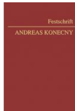
Festschrift Konecny Ladenpreis: 178,00 EUR