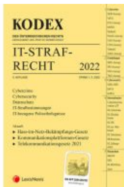
KODEX IT-Strafrecht 2022 - inkl. App Ladenpreis: 30,00 EUR