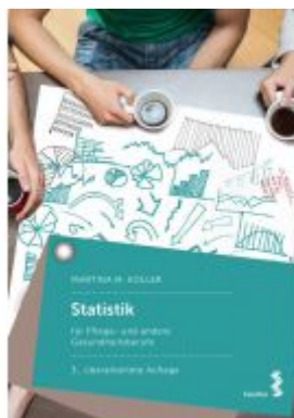
Statistik für Pflege- und andere Gesundheitsberufe Ladenpreis: 26,90 EUR