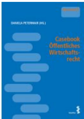
Casebook Öffentliches Wirtschaftsrecht Ladenpreis: 28,00 EUR