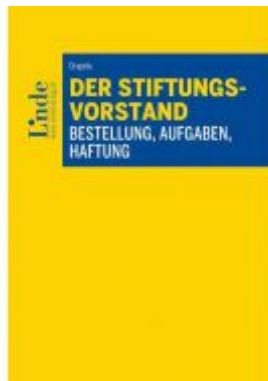
Der Stiftungsvorstand - Bestellung, Aufgaben, Haftung Ladenpreis: 54,00 EUR