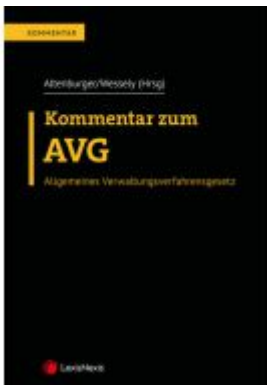
Kommentar zum AVG Ladenpreis: 218,00 EUR