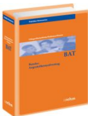
BAT Kommentar Ladenpreis: 665,20EUR