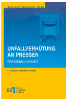
Unfallverhütung an Pressen Ladenpreis: 102,70EUR