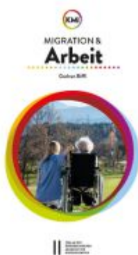
Migration und Arbeit Ladenpreis: 19,00EUR