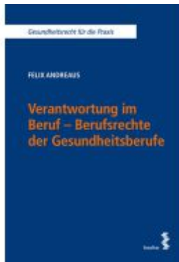
Verantwortung im Beruf - Berufsrechte der Gesundheitsberufe Ladenpreis: 42,00EUR