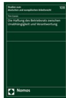
Die Haftung des Betriebsrats zwischen Unabhängigkeit und Verantwortung Ladenpreis: 101,80EUR