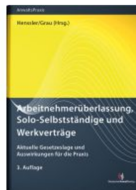
Arbeitnehmerüberlassung, Solo- Selbstständige und Werkverträge Ladenpreis: 65,80EUR