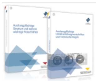
Das Aushang-Paket Ladenpreis: 99,80EUR