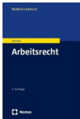
Arbeitsrecht Ladenpreis: 27,70EUR