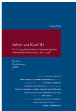
Arbeit am Konflikt Ladenpreis: 91,50EUR

Wir haben andere Produkte gefunden, die Ihnen gefallen könnten!