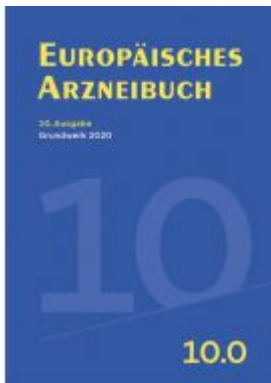
Europäisches Arzneibuch Ladenpreis: 248,00 EUR

Wir haben andere Produkte gefunden, die Ihnen gefallen könnten!