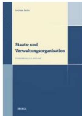
Staats- und Verwaltungsorganisation Ladenpreis: 30,00 EUR