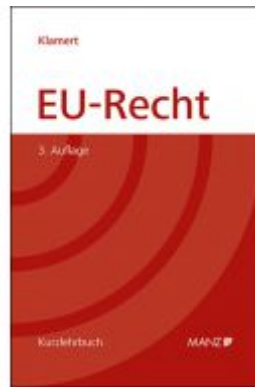
EU-Recht Ladenpreis: 59,00 EUR