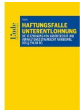
Haftungsfalle Unterentlohnung Ladenpreis: 66,00 EUR