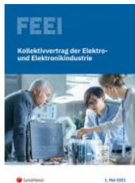
Kollektivvertrag der Elektro- und Elektronikindustrie 2021 Ladenpreis: 22,00 EUR