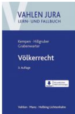
Völkerverrecht Ladenpreis: 35,90 EUR