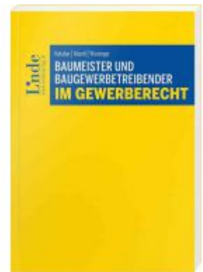
Baumeister und Baugewerbetreibender im Gewerberecht Ladenpreis: 44,00 EUR