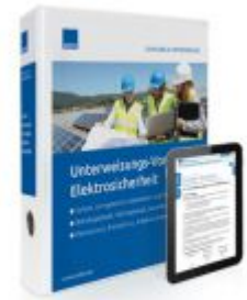
Unterweisungs-Vorlagen Elektrosicherheit Ladenpreis: 207,90 EUR