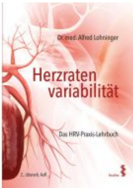
Herzratenvariabilität Ladenpreis: 46,90 EUR