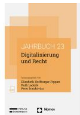
Digitalisierung und Recht Ladenpreis: 98,00EUR