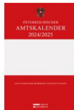
Österreichischer Amtskalender 2024/2025 Ladenpreis: 345,00EUR