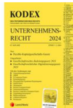
KODEX Unternehmensrecht 2024 - inkl. App Ladenpreis: 42,50EUR