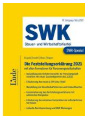
SWK-Spezial Die Feststellungserklärung 2021 Ladenpreis: 48,00EUR