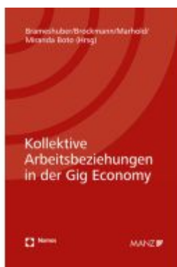
Kollektive Arbeitsbeziehungen in der Gig Economy Ladenpreis: 64,00EUR