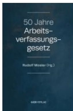
50 Jahre Arbeitsverfassungsgesetz Ladenpreis: 79,00EUR