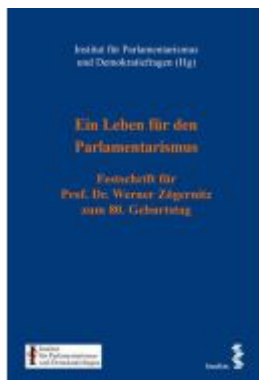
Ein Leben für den Parlamentarismus Ladenpreis: 160,00EUR

Wir haben andere Produkte gefunden, die Ihnen gefallen könnten!