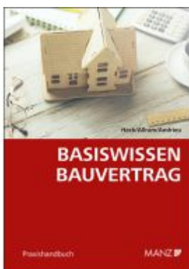
Basiswissen Bauvertrag Ladenpreis: 48,00EUR