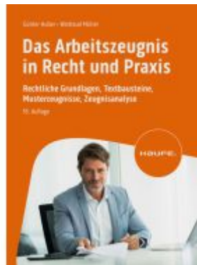
Das Arbeitszeugnis in Recht und Praxis Ladenpreis: 51,40EUR