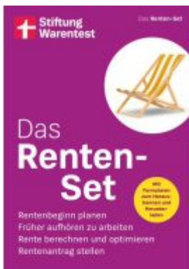
Das Renten-Set Ladenpreis: 17,40EUR