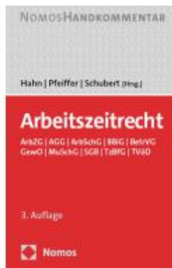
Arbeitszeitrecht Ladenpreis: 101,80EUR