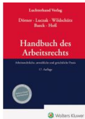
Handbuch des Arbeitsrechts Ladenpreis: 194,30EUR