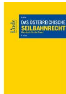
Das österreichische Seilbahnrecht Ladenpreis: 139,00EUR