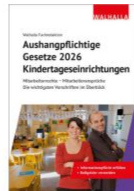
Aushangpflichtige Gesetze 2026 Kindertageseinrichtungen Ladenpreis: 15,00EUR