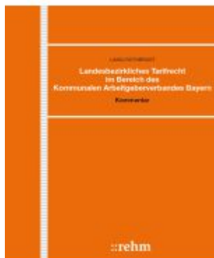
Landesbezirkliches Tarifrrecht im Bereich des Kommunalen Arbeitgeberverbandes Bayern Ladenpreis: 201,50EUR