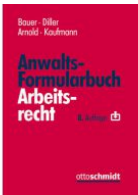
Anwalts-Formularbuch Arbeitsrecht Ladenpreis: 132,70EUR