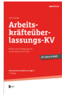
Arbeitskräfteüberlassungs-KV Ladenpreis: 42,00EUR