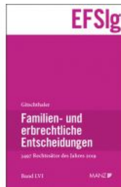
Familien- und erbrechtliche Entscheidungen EF-Slg Ladenpreis: 240,00 EUR