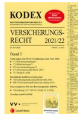
KODEX Versicherungsrecht Band I 2021/22 - inkl. App Ladenpreis: 75,00 EUR