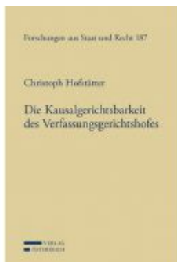
Die Kausalgerichtsbarkeit des Verfassungsgerichtshofes Ladenpreis: 174,00 EUR