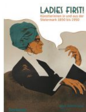
Ladies First! Künstlerinnen in und aus der Steiermark 1850–1950 Ladenpreis: 30,00 EUR