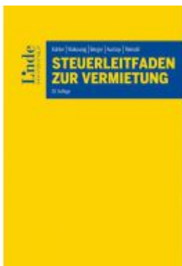
Steuerleitfaden zur Vermietung Ladenpreis: 98,00 EUR