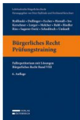
Bürgerliches Recht Prüfungstraining Ladenpreis: 39,00 EUR