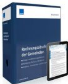
Rechnungsabschluss der Gemeinden Ladenpreis: 207,90 EUR