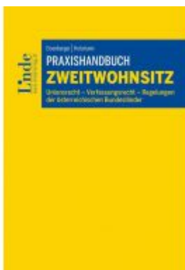
Praxishandbuch Zweitwohnsitz Ladenpreis: 44,00 EUR