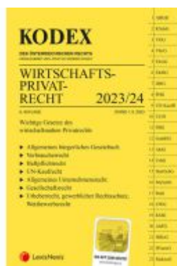
KODEX Wirtschaftsprivatrecht 2023/24 - inkl. App Ladenpreis: 29,80EUR