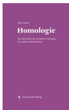
Homologie Ladenpreis: 34,90EUR