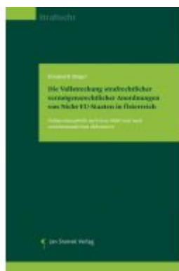
Die Vollstreckung strafrechtlicher vermögensrechtlicher Anordnungen von Nicht-EU-Staaten in Österreich Ladenpreis: 78,00EUR