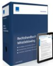
Rechtshandbuch Whistleblowing Ladenpreis: 250,80EUR