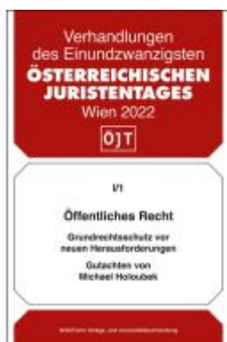
Öffentliches Recht Grundrechtsschutz vor neuen Herausforderungen Ladenpreis: 48,00EUR