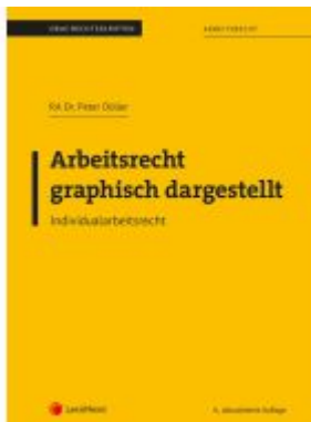
Arbeitsrecht graphisch dargestellt Ladenpreis: 26,25EUR

Wir haben andere Produkte gefunden, die Ihnen gefallen könnten!