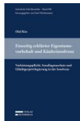
Einseitig erklärter Eigentumsvorbehalt und Käuferinsolvenz... Ladenpreis: 107,10EUR