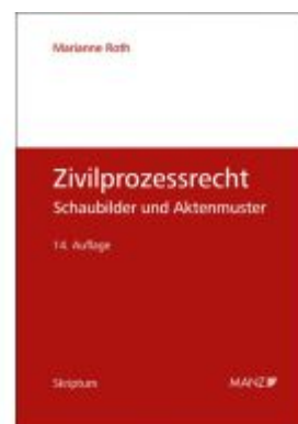
Zivilprozessrecht Schaubilder und Aktenmuster Ladenpreis: 42,00EUR