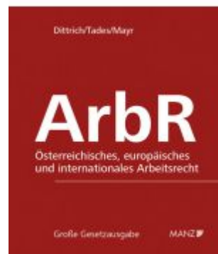
Arbeitsrecht Ladenpreis: 338,00EUR