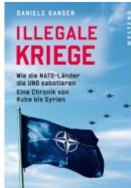
Illegale Kriege Ladenpreis: 25,70EUR