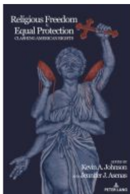
Religious Freedom v. Equal Protection Ladenpreis: 128,30EUR