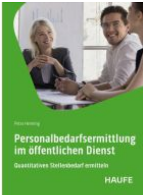
Personalbedarfsermittlung im öffentlichen Dienst Ladenpreis: 51,40EUR