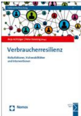
Verbraucherresilienz Ladenpreis: 35,00EUR