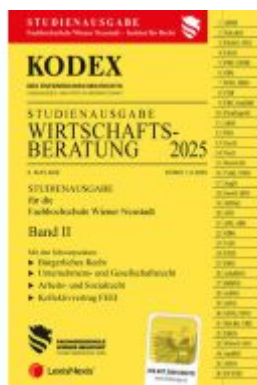
KODEX Wirtschaftsbearbeitung 2025 Band II - inkl. App Ladenpreis: 26,00EUR