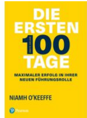
Die ersten 100 Tage Ladenpreis: 19,95EUR