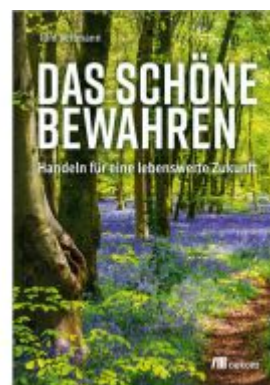
Das Schöne bewahren Ladenpreis: 22,70EUR