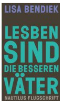
Lesben sind die besseren Väter Ladenpreis: 22,70EUR