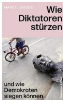
Wie Diktatoren stürzen Ladenpreis: 28,80EUR