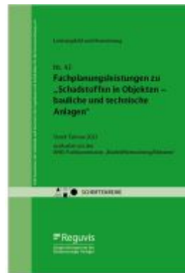
Fachplanungsleistungen zu „Schadstoffen in Objekten – bauliche und technische Anlagen“ Ladenpreis: 20,40EUR