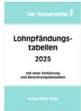
Lohnpfändungstabellen 2025 Ladenpreis: 27,50EUR