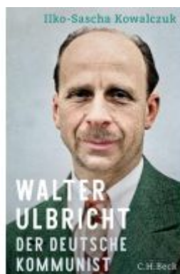
Walter Ulbricht Ladenpreis: 59,70EUR