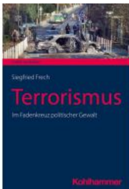
Terrorismus Ladenpreis: 24,70EUR