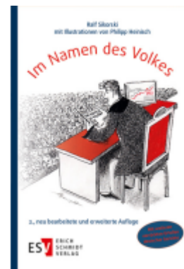
Im Namen des Volkes Ladenpreis: 38,90EUR