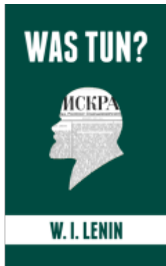
Was tun? Ladenpreis: 12,00EUR