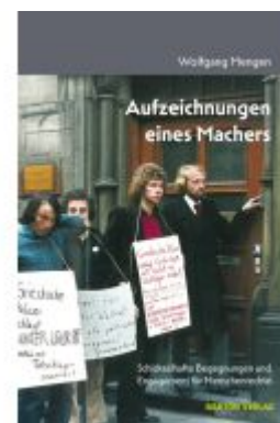
Aufzeichnungen eines Machers Ladenpreis: 18,00EUR