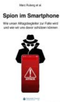
Spion im Smartphone Ladenpreis: 16,50EUR

Wir haben andere Produkte gefunden, die Ihnen gefallen könnten!